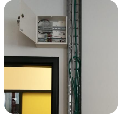
Controller für Türsteuerung

Der Zugang zu den Co-Working Spaces wird über den KleverKey Controller gesteuert. Die Integration des Controllers erfolgt sehr einfach in Kombination mit elektrischen Türöffnern. Dies erlaubt eine unkomplizierte und günstige Installation von Smartphone-basierter Zutrittssteuerung.